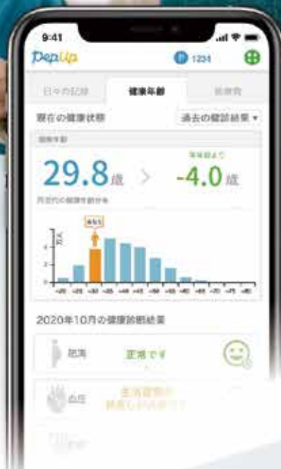
※画面はイメージです。実際の画面とは異なる場合があります。

健康づくりへの取り組みで、各社ポイントや電子マネーを始めとした、素敵な商品と交換ができるPepポイントが貯まります。